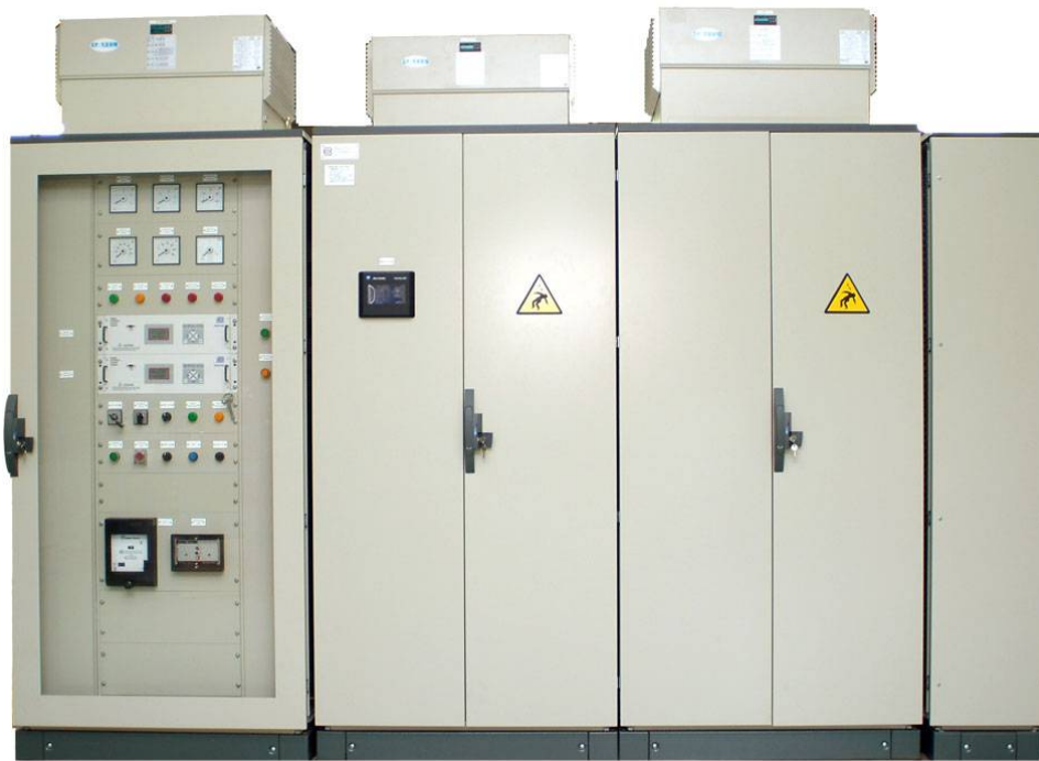
Statický budicí systém