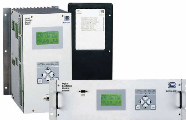
Digitální regulátory řady DECS

Uživatelsky navržené budicí systémy pro všechny typy aplikací bez ohledu na hnací soustrojí. Naše digitální budicí systémy zvyšují výkon a zlepšují efektivitu nových i rekonstruovaných systémů. Naše řešení je vhodné pro budicí proudy až do 10,000 Ampér, díky tomu můžeme nabídnout řešení pro kompletní rozsah požadavků na budicí systémy.